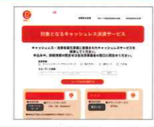
ポイント還元事業ホームページ