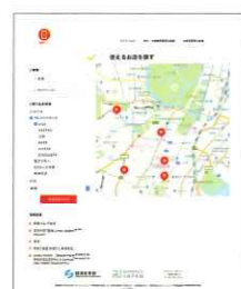
ポイント還元事業ホームページ